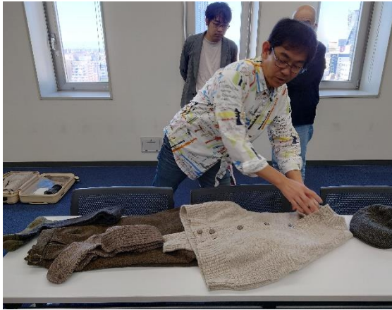
「こんなコーディネートではどうでしょうか？」