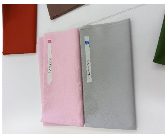
「こちら(左:ピンク 右:グレー)もよく似て見えます。」