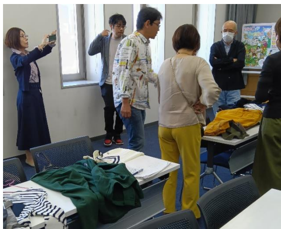
D 型の方がカラーリストさんに質問しています。