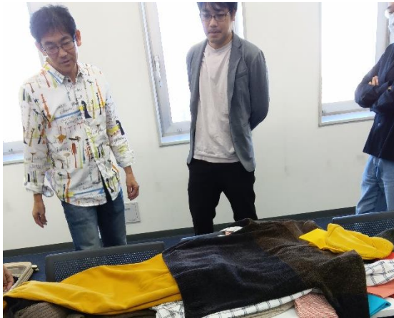
カラーリストお勧めのコーディネートで D 型の方たちがじっくりと見えています。