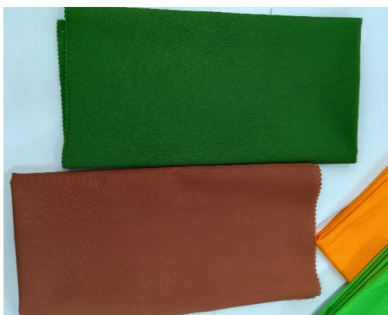
「この 2 色(上:緑 下:茶)はよく似て見えます。」