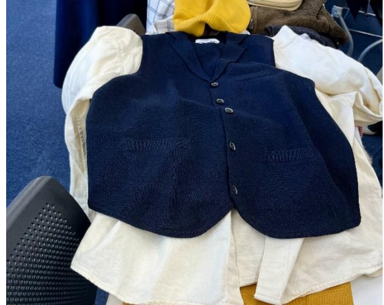
「こちらは良いですね」と皆さんから声が挙がりました。