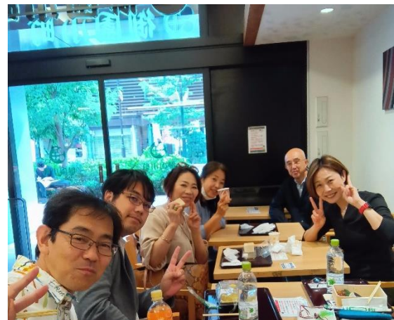
和やかなランチ交流会