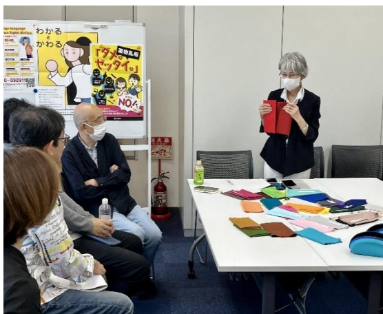
赤が好きな D 型の方へ「赤でもどちらを好きで身につけますか？」