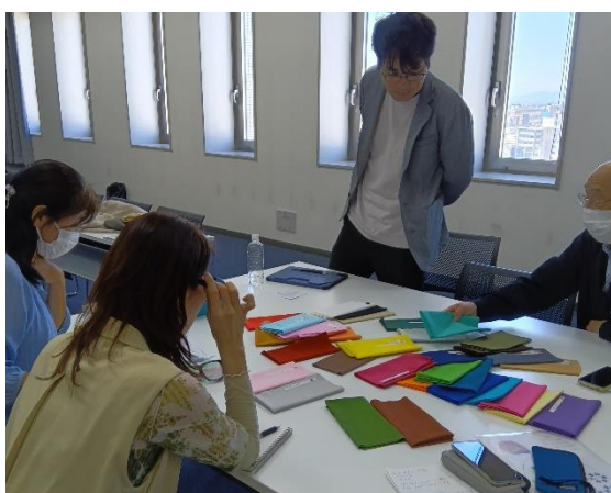
C 型の方がバリエーションを掛けながら、K さんから色の選び方の説明を受けています。