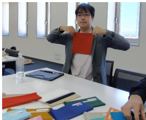
「こちらの赤ですね。」