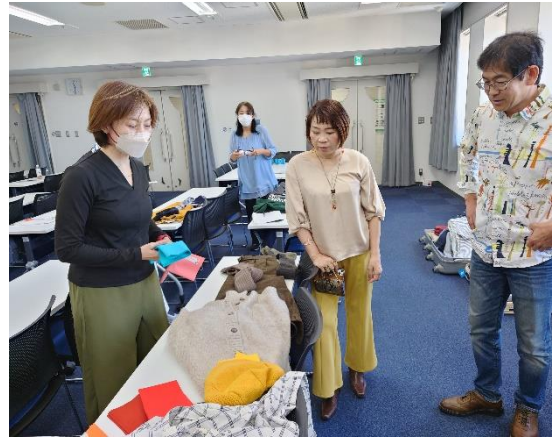
カラーリストさんがコーディネートを変えています。